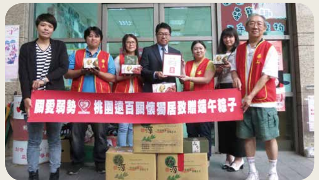
关怀独居老人，桃园远百 6 月 2 日将募得之粽子全数交付华山社会福利慈善基金会分送在地弱势老人，让长者们欢度佳节。