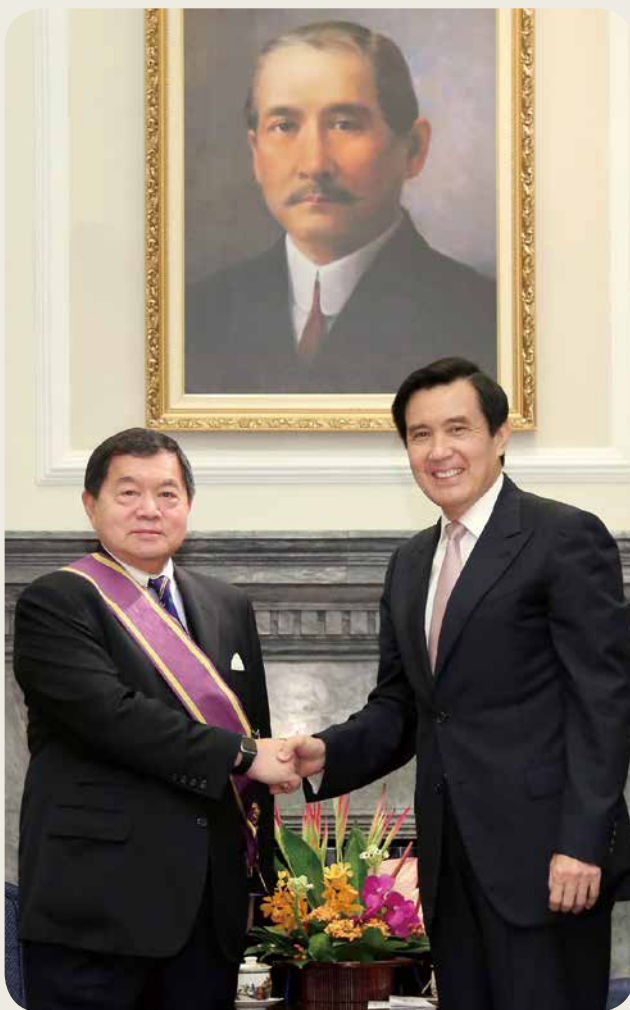
➤ 远东集团徐旭东董事长（左）5月16日获时任总统马英九先生（右）颁授「二等景星勋章」，表彰其长期致力工、商业发展，协济公益事业，善尽企业社会责任等杰出贡献。