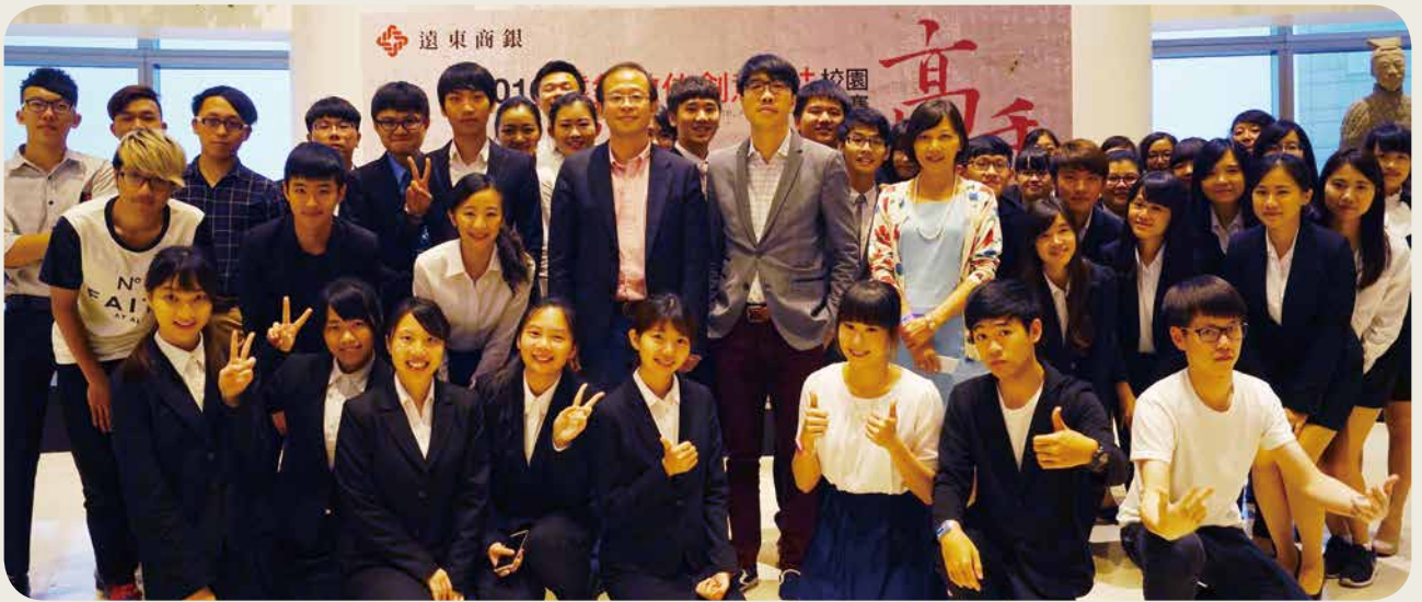
为培养年轻族群的数位金融创意，远东商银举办 2016「数位创意王+」校园竞赛，并于 5 月 27 日进行决赛暨颁奖典礼。