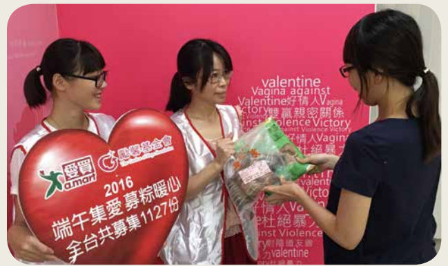
爱买与励馨基金会合作「端午送爱 募粽暖心」计画，今年认购总数创历年新高，约六百户家庭受惠。