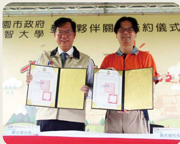
➤ 元智大学吴志扬校长（右）与桃园市郑文灿市长（左）5月21日签署合作备忘录，未来将就青年创业创新等众多项目展开合作。