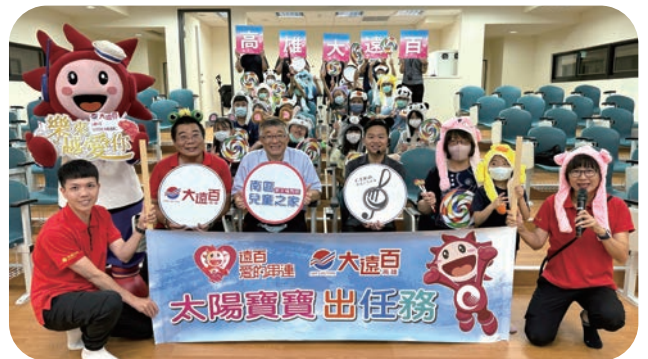
高雄大远百与嘉义市管乐团跨界组成一日志工，前往南区儿童之家陪伴孩童，用音符传递温暖。