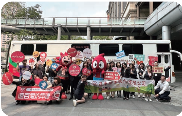
亚东证券联合板桥大远百发起爱心捐血活动，获得同仁热情响应。