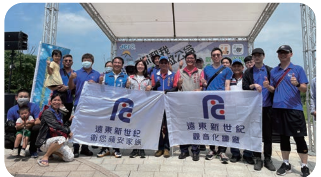
远东新世纪观音化纤厂号召同仁前往观音海水浴场，参与「海有我和您，净力做公益」净滩活动，展现对于 ESG 的重视。