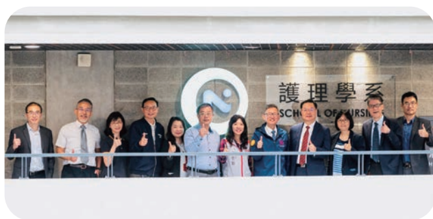
👤 元智大学在廖庆荣校长（右四）主持下，隆重举行护理学系揭牌仪式，宣布将引进最新颖的教学模型及仪器设备，提供学生最优质的学习环境。