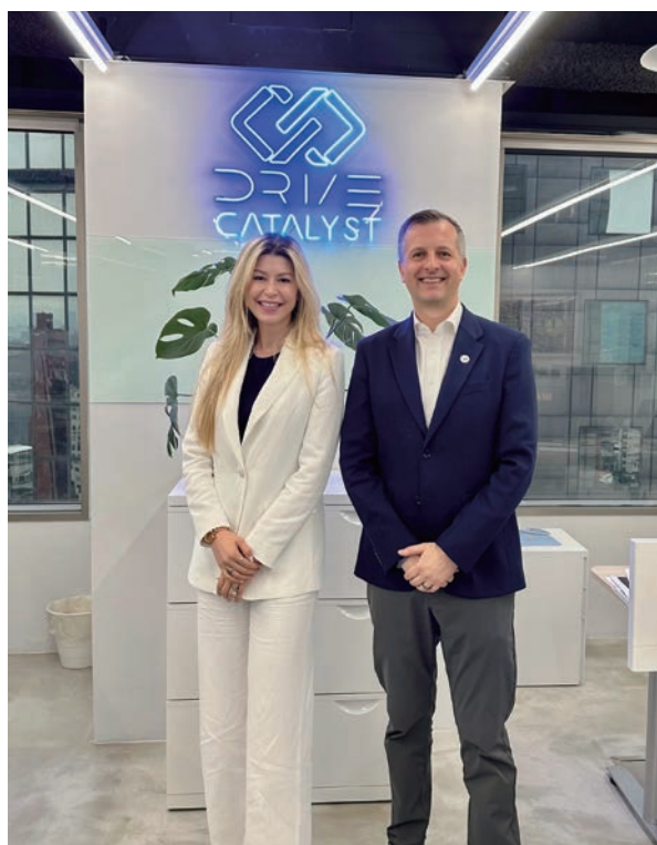
Drive Catalyst's Managing Director and Circ's President came together to commemorate sealing a new partnership and commitment to the circular economy.

Moreover, Drive Catalyst complements its direct investments with strategic placements in top-tier venture capital funds—including the E14 Fund (affiliated with MIT Media Lab), Pioneer Fund (Y Combinator alumni), and Hustle Fund (an early-stage global seed investor). These partnerships grant the team access to exclusive deal flow, global insights, and a dynamic network of entrepreneurs operating at the forefront of science and technology.