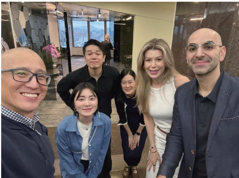
Drive Catalyst 与麻省理工学院关联创投基金 E14 Fund 交流 接轨国际新创 共创新局。

• Ambercycle : 开发聚酯纺织品回收再生技术，荣获《TIME》2024 年度最佳创新殊荣。