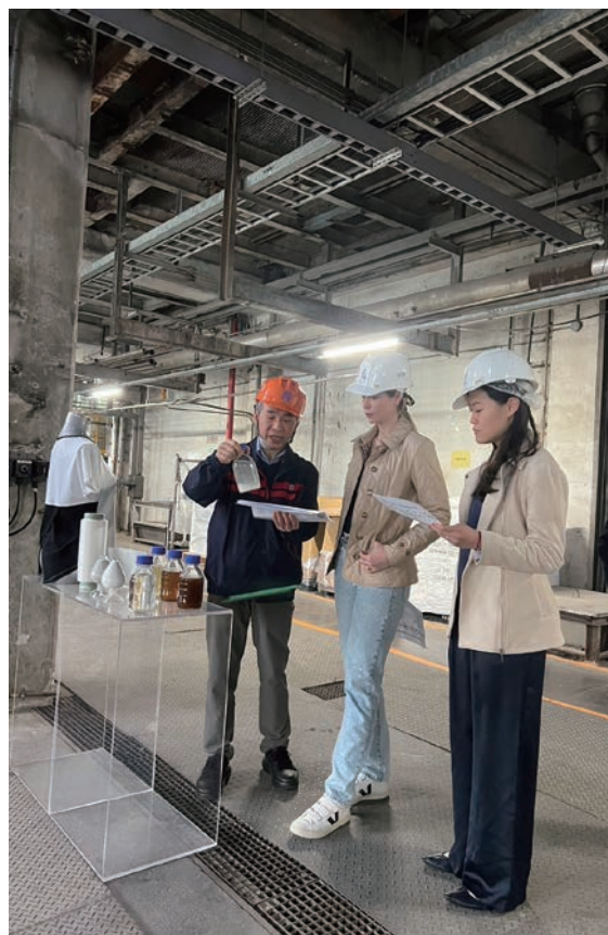
Drive Catalyst 团队参访远东集团研发中心位于新埔的化学回收先导工厂。

Drive Catalyst 目前已与数十家关系企业展开具体对话与合作，包括上述所提企业，以及亚洲水泥、宏远兴业、远东商银、远东