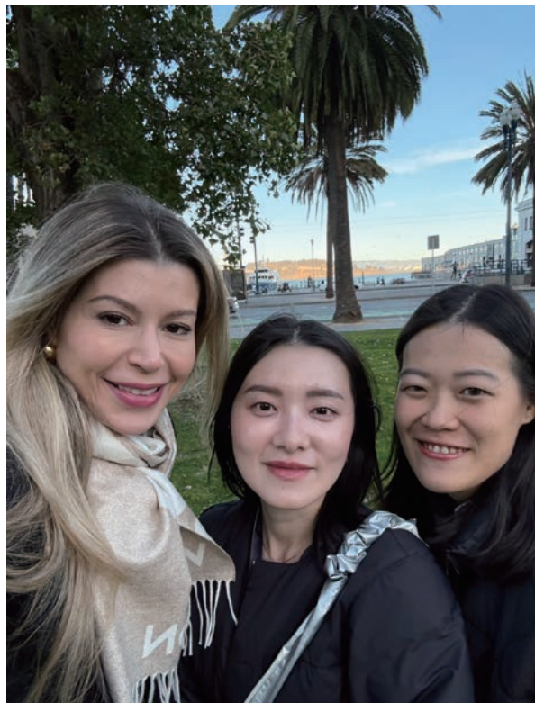
Drive Catalyst's field trip to attend TechCrunch Disrupt 2024 in San Francisco.

2. Sustainable Tech at Scale: From circular polyester to metal-organic frameworks (MOFs), biomanufacturing of Vitamin A, and advanced 3D printing technology, Drive