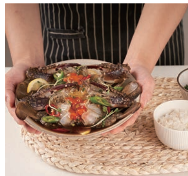
📍 K-Food 来到台湾经过改良，更符合在地人口味／高雄大远百提供