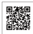
股东 e 服务平台

e 柜台无纸化、数位签章免临柜，还可以线上追踪进度，不仅安全有效力，也能节能减碳爱地球，有需要的民众不妨一试！