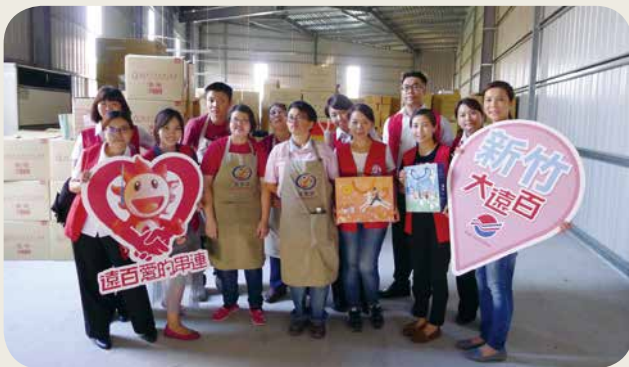
📍 中秋节是喜憨儿烘焙工坊忙碌的大节日，8 月 26 日远百新竹店号召员工担任一日志工，协助喜憨儿月饼礼盒包装，一起挽袖作公益。