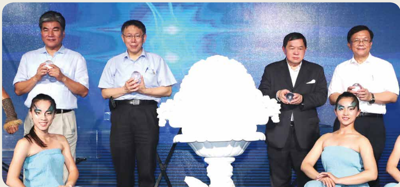
➤ 远东集团徐旭东董事长（后排右二）、柯文哲市长（后排左二）、李世光部长（后排右一），以及李鸿源教授（后排左一），手持象征水资源的水晶球，为远东水展览闭幕。