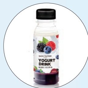
④ 雪坊「综合野莓瓶装优格饮」(新竹大远百提供)