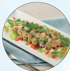
④ 义式屋古拉爵「烟熏鸭胸佐蜂蜜芥末酱」