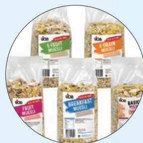
④ Viola「德国早餐麦片」(高雄大远百提供)

饮食不仅是能量的摄取，更是我们与季节对话的方式。在这个高温难耐的时节，与其被动地忍受燥热，不如主动调整餐桌上的风景，享受身心的清爽与余裕。