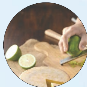
④ AMO「柠檬蛋糕」

追求沁凉口感者， Mister Donut 充满果丁的「爱文芒果冰沙」，或 哈根达斯 结合野莓冰淇淋、复盆子雪酪与瓦夫脆饼的「瓦夫假期」，都是层次丰富的冰品；至于 雪坊 的「综合野莓瓶装优格饮」，以100%纯鲜乳制成的无糖优格，搭配蓝莓、黑莓、复盆子三种野生莓果酱，更是广受养生达人喜爱。