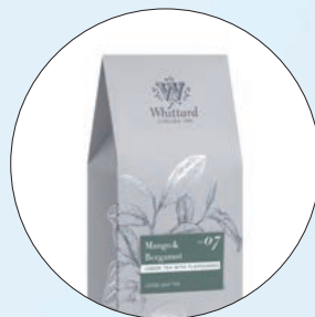
📍 Whittard 芒果佛手柑绿茶盛宴