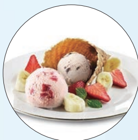
④ 哈根达斯「瓦夫假期」