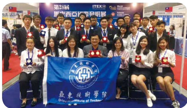
↑ 亚东技术学院率队参与第 28 届马来西亚 ITEX 国际发明创新科技展，成绩优异，荣登台湾团队最大赢家。