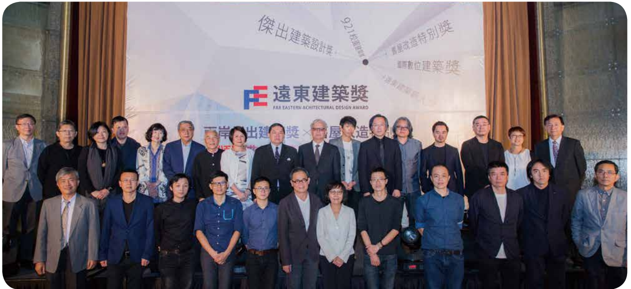
徐元智先生纪念基金会 5 月 20 日举办「第九届远东建筑奖颁奖典礼及建筑名家讲座」，评审团与两岸得奖者合影。