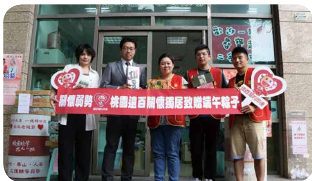
↑ 远百桃园店与华山基金会合作办公益捐赠活动，共募集 117 颗粽子，帮助在地独居老人同庆端午。