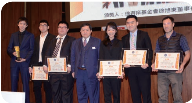
⬆ 「徐有庠杯——第十届台湾青年学生物理辩论赛」3月19日举办闭幕及颁奖典礼，基金会徐旭东董事长（右四）特别出席颁奖，并与获得总冠军的队伍合影留念。