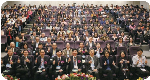
元智大学3月15日主办「AI与金融科技论坛」，邀请产官学界共同探讨人工智慧与金融科技的发展现况，以及未来跨域合作模式等议题。