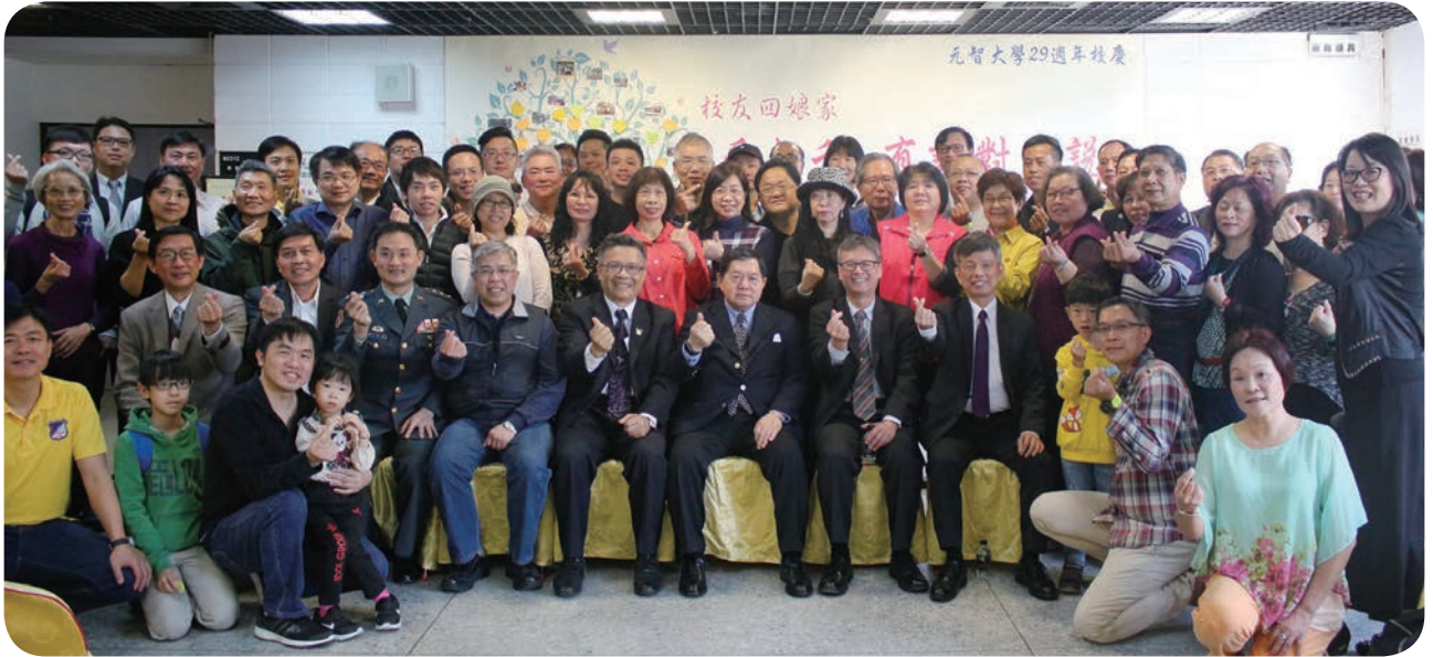
⬆ 元智大学3月24日举行校友回娘家—「爱无私，有话对您说」活动，徐旭东董事长（前排中）也应邀出席，呼吁校友发挥大爱，关心周边需要帮助者及弱势族群。