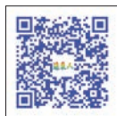
扫描 QR Code 看英文版

正所谓「30而立」，30岁是人生的学习阶段告一段落，需要重新思考未来方向的时刻。元智即将在明年迈入30岁，应该有更远大的眼光与目标，希望各位深切思考，除了教学培育人才之外，学校的研究、训练，如何与企业相辅相成？如何顺应时代的需求、全球环境的改变，以及台湾产业结构的变化，不断调整、升级，让元智更具竞争力？在这个值得庆贺的日子，请容许我提醒大家「改变」的重要性，一定要不断求新求变，向上精进，才能迎头赶上新经济时代！