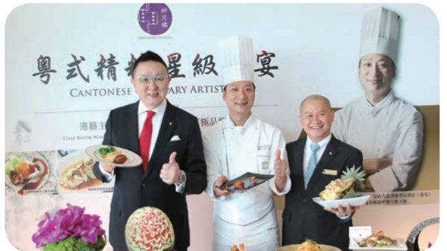
香格里拉台南饭店3月29日隆重举行记者会，宣布将于醉月楼推出为期十日的粤式精粹星级盛宴，邀请民众品尝来自米其林餐厅的顶级粤菜。