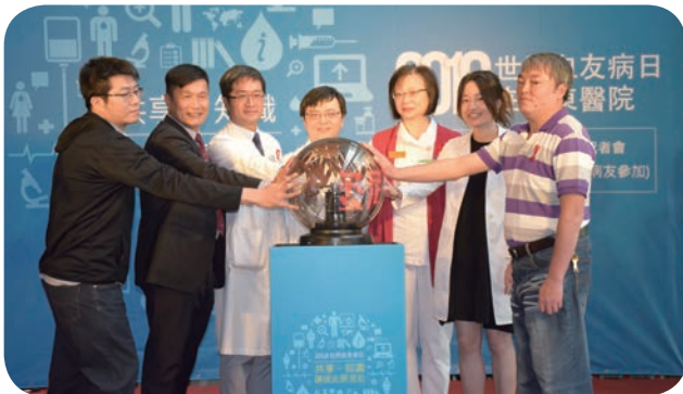
为呼应世界血友病日，亚东医院以代表血友病的红色，光雕整片外墙，并于4月11日的记者会上举行点灯仪式，为血友病友打气。