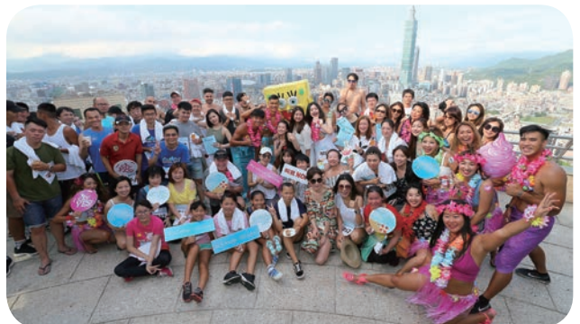
⬇ 香格里拉台北远东饭店 6 月 9 日举办「凉夏乐登高」运动派对，吸引百余位嘉宾一同参与登高盛事。