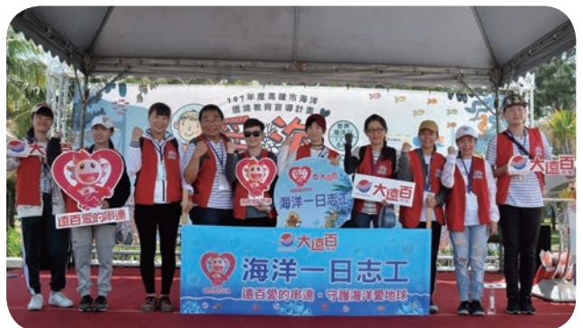
⬇ 高雄大远百同仁热情参与「2018 世界海洋日」净滩活动，以实际行动守护海洋。