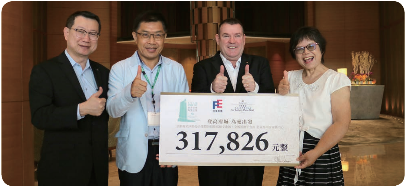
⬇ 香格里拉台南远东饭店 5 月 15 日举办捐赠仪式，凯德曼总经理（右二）将本届登高公益赛事所得 317,286 元赠予台北家服社淑惠主任（右一）与南家扶李保良主任（左二）。