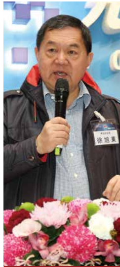
远东集团 徐旭东董事长