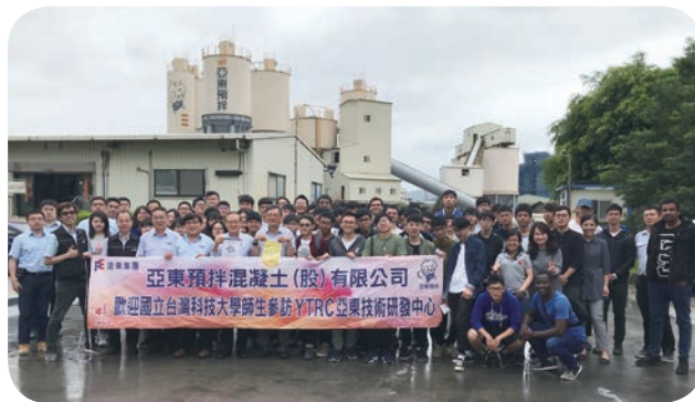
亞東預拌混凝土技術研發中心專業技術深獲各界肯定，國立台科大師生亦多次率團取經。