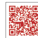
《卡到英》 电影学英文

远传旗下数位品牌 friDay 影音与 ICRT 电台合作举办「《卡到英》电影学英文」活动，8月31日前，输入指定序号即可免费观看热门强片，并邀请 ICRT DJ 将片中英文对话录制成教学影片，提供偏乡孩童学习。此外，民众每观看一片，远传即捐出1元，作为偏乡孩童生活照护基金。（远传电信／何思纬）