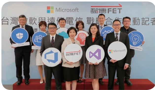
⬆ 远传电信井琪总经理（前排左二）与台湾微软孙基康总经理（前排右一）率领团队宣布将正式启动战略合作，加速产业布局。