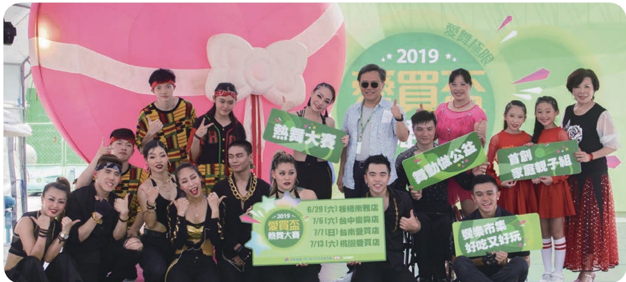
第三屆愛買杯熱舞大賽 6 月 29 日于板橋南雅店熱鬧登場，今年特別結合了公益與市集，吸引各組报名人数创纪录。