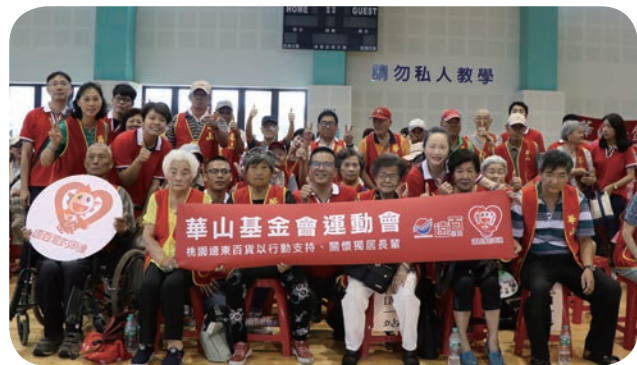
遠百桃園店率同仁參與華山基金會舉辦的運動會，以實際行動關懷獨居長輩。