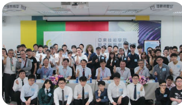
亞東技術學院舉辦 2019 點子學園創客競賽，鼓勵學生發想符合市場機制的創新營運模式。