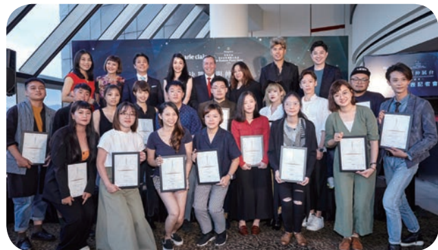
香格里拉台北遠東飯店 6 月 28 日發表「決戰禮服伸展台——我的完美婚紗在哪里」婚紗設計比賽前 20 強名單，並預告 10 月 3 日將於飯店全新宴會廳舉行總決賽。