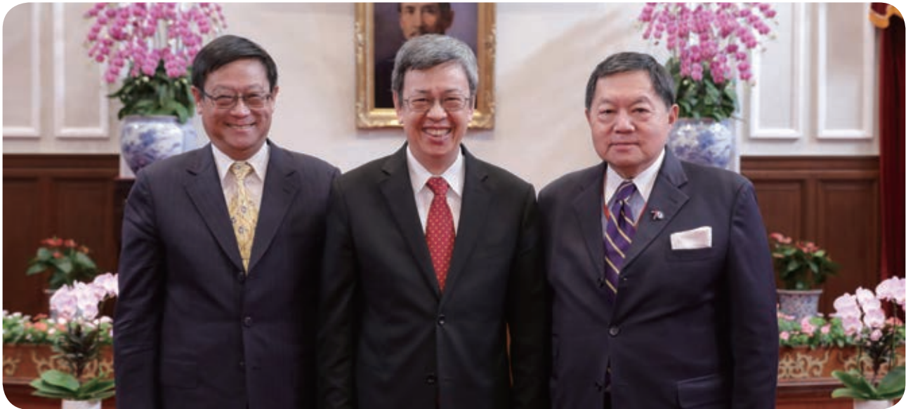
远传和远东 SOGO 百货双获第一届「国家企业环保奖」，颁奖典礼后，陈建仁副总统（中）接见获奖企业代表，徐旭东董事长亲自出席。