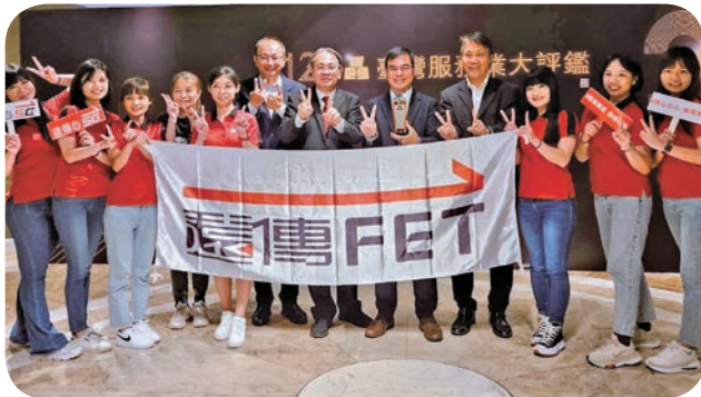
2023「台湾服务业大评鉴」成绩揭晓，远传电信蝉联电信通路服务金牌奖，达成全台唯一的12连霸佳绩，团队开心合影留念。