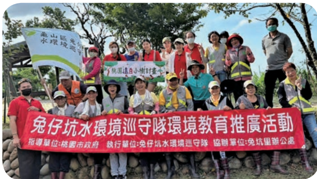
远东百货桃园店与桃园市兔仔坑发展协会合作举办「桃园远百小树计画」，同仁与志工一同种植樱花树、枫树，维护山林环境。