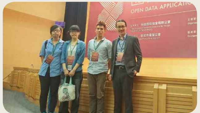
元智大學 Air Tetris 團隊設計多維度資料的數據視覺化平臺，獲得經濟部「一秒搞懂政府網站創意競賽」優秀團隊獎與 10 萬元獎金。