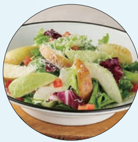
① 義式屋古拉爵「巴沙米可油醋蔬果沙拉」

除了涼拌開胃菜，優質蛋白質與清爽調味的結合亦是首選。21PLUS 的「鮮蔬手撕雞」，拌入獨家雞汁與六種蔬菜，提供充足的蛋白質與纖維，爽口不油膩；翰林茶館的「茶香鳳梨虱目魚肚」，則是利用在地虱目魚搭配特製鳳梨醬，果香與微酸甜感融