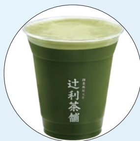
📍 辻利茶舖輕抹茶

茶飲方面，綠茶、烏龍茶富含茶多酚，具有抗氧化與調節血脂的效果，同時能提供微量礦物質；而抹茶含有獨特的茶胺酸，能在提振精神的同時，緩和咖啡因帶來的焦慮感。茶香與果香的碰撞，為酷熱的夏季帶來優雅的清涼感。推薦 Starbucks 融合蜂蜜紅柚醬的「阿里山蜜柚烏龍青茶」，層次豐富且回甘不膩；瓦城的「柚香翡翠綠茶」馥郁酸甜、風味細緻；先喝道結合四季春茶王與酸甜青梅