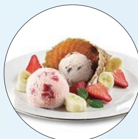
哈根達斯「瓦夫假期」