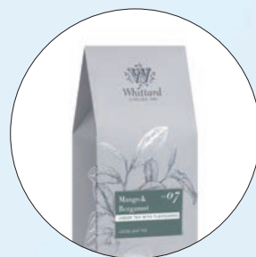
📍 Whittard 芒果佛手柑綠茶盛宴