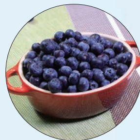
📍 c!ty'super 「美國藍莓」

夏季容易出汗，大量流失水分之餘，也同步流失電解質。除了多喝水，西瓜、小黃瓜、冬瓜等高含水量的瓜果類食材，也是溫和的補水方式。尤其自然熟成的當季瓜果，農藥與人工催熟劑的使用量相對較少，風味也更加完整，例如 c!ty'super 推薦的「美國藍莓」，在盛夏產季果實飽滿多汁，冰鎮後食用備感沁涼，同時富含花青素，亦是夏日營養補給的好選擇。