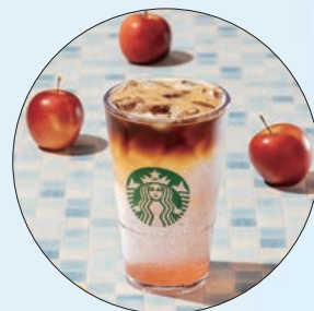
📍 星巴克「蘋果山茶花風味氣泡美式」

咖啡愛好者不妨嘗試帶有明亮水果香氣的品項，例如 Starbucks 的「檸檬冷萃咖啡」與「蘋果山茶花風味氣泡美式」，或是都可 CoCo 的「西西里手搗檸檬美式」，香純的咖啡無論搭配微酸的鮮搗檸檬、清甜的蘋果山茶醬，或是爽口的氣泡，都讓人精神為之一振。