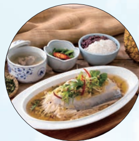
③ 翰林茶館「茶香鳳梨虱目魚肚」