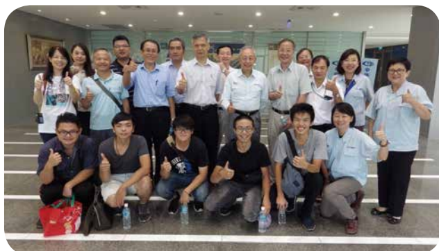
亞東技術學院機械工程系師生於9月7日參訪中國端子電業公司，希望加強雙方未來產學合作的機會。