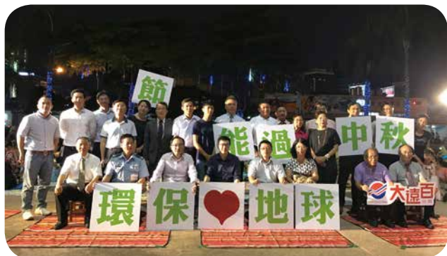
響應低碳環保理念，臺南大遠百與臺南市政府環境保護局合作推出「中秋『揪』想和你一起野餐趣」活動，鼓勵市民關掉電源，走出戶外。