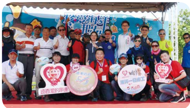
高雄大遠百攜手高雄市政府海洋局，號召同仁共同參與「珍愛海洋齊步走 旗津 GO」淨灘活動，為海洋減塑盡一份心力。