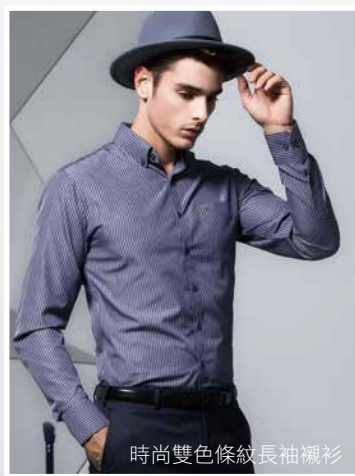
時尚雙色條紋長袖襯衫

註：「Fashion Snoops」全球性時尚潮流趨勢預測機構和專業資訊供應商，專門負責搜集、分析整理、編輯即時的趨勢信息。