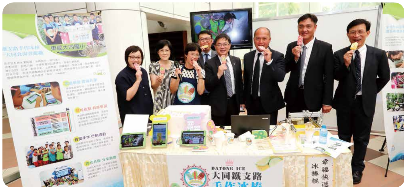
遠傳電信與臺南市政府、美國高通公司、工業技術研究院及華碩共同宣布擴大「臺南市雲遊學計畫」，開創新型態的行動學習模式，嘉賓們在記者會現場參觀創意課程展示攤位。