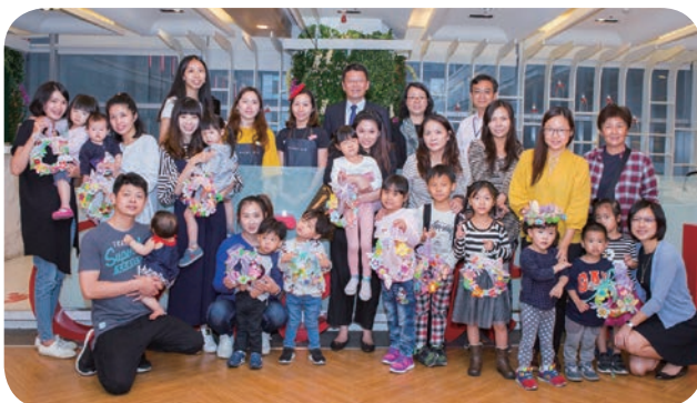
臺中大遠百邀請知名創作教室「畫飲」聯合舉辦親子花園 DIY 課程，獲得熱烈回響。