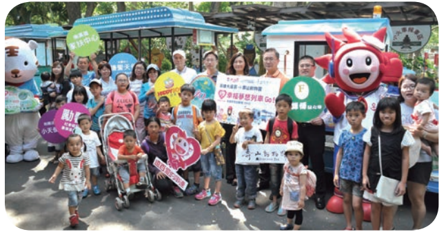
高雄大遠百攜手高雄市政府觀光局、壽山動物園舉辦「遠百愛的串連—幸福夢想列車」車票募集公益活動，邀請三大社福團體照顧的家庭與小朋友共 200 人，相約壽山動物園歡度母親節。