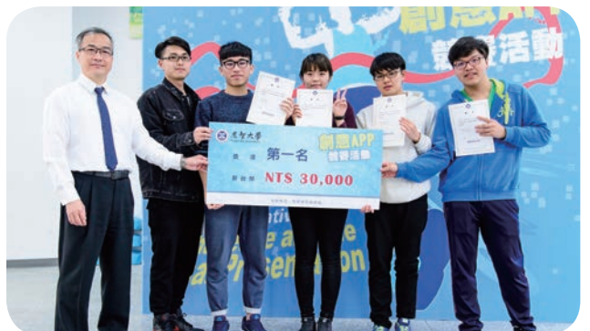
元智大學舉辦「創意 APP 實作競賽」，最終由資工與資傳學生，以多功能校園救助 APP「WEGO」勇奪冠軍。