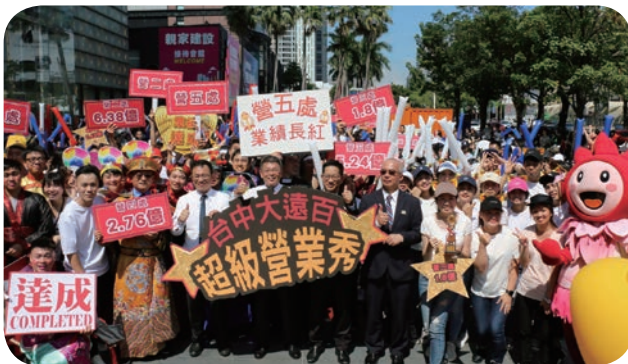
📍 臺中大遠百 9 月 26 日熱鬧舉辦週年慶誓師大會及星光大道走秀活動，為即將展開的週年慶暖場。