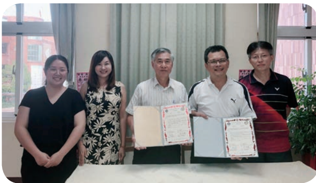
📍 元智大學與草漯國小簽署合作備忘錄，未來雙方將共同提升觀音區小學學生數位能力與資訊素養。