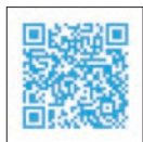
friDay 購物 「Shopping 做愛心」