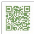
friDay 影音 「等家寶寶」 線上影展