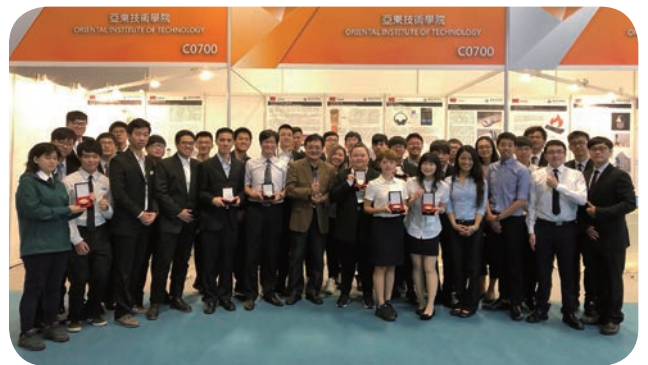
📍 亞東技術學院師生參與「2018 年臺灣創新技術博覽」，勇奪 1 金、5 銀、2 銅，以及發明競賽最高榮譽「鉑金獎」。