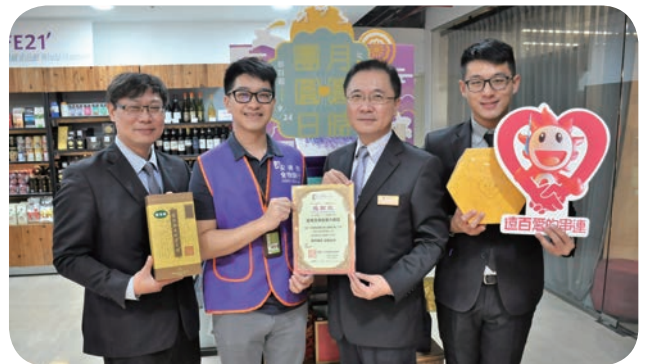
📍 高雄大遠百發起「散播希望種子・愛心月餅募集」禮盒認捐公益，並由毛郅國店長（右二）代表，將民眾的愛心捐予社團法人中華安得烈慈善協會，讓需要幫助的家庭感受佳節的溫馨。