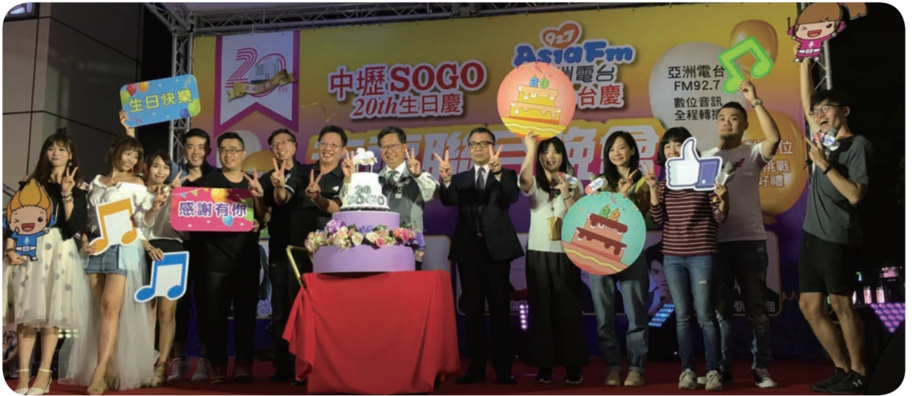
📍 SOGO 中壢店歡慶 20 週年，9 月 24 日特別攜手亞洲電臺舉辦「幸福聯合晚會」，並邀請桃園市鄭文燦市長一同切蛋糕，期許商圈再創榮景。