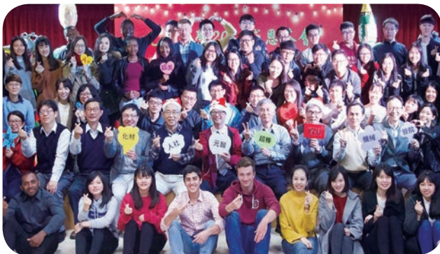
元智大學於 2018 年 12 月 20 日舉辦感恩茶會，吳志揚校長（第二排中）頒獎表揚一年來對外參賽成績優異之學生及指導老師。