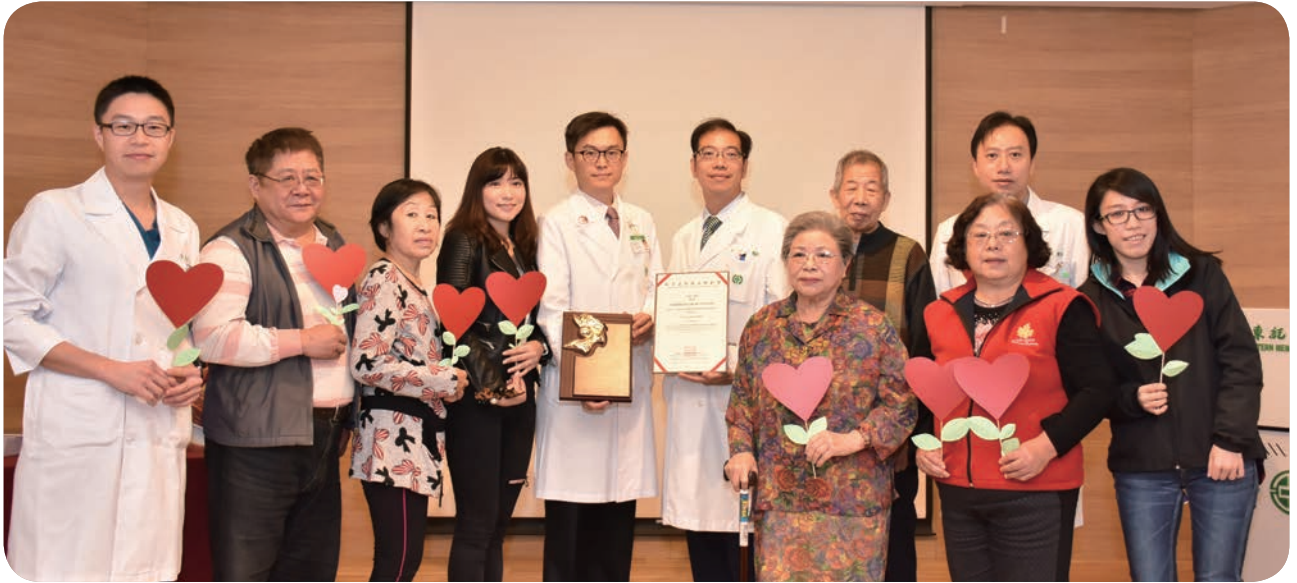
➡ 亞東醫院心臟醫學團隊於 2018 年底以「內視鏡微創心臟手術」，勇奪生技界最高榮譽——「第十五屆國家新創獎」。