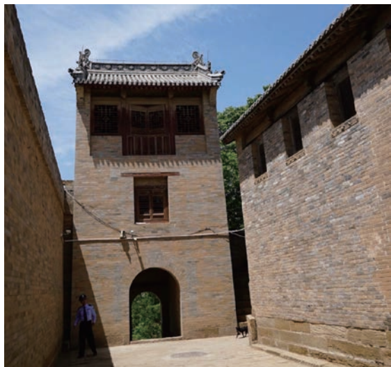
▲ 高平迄今依舊古意盎然。

哀卻不悲慘；相反的，若是只有丁點才能，卻因緣際會被大用，那麼不只是他個人的悲哀，往往還會造成一個時代、一大群人的悲慘下場！最著名的例子之一就是趙括。這位先生是趙國名將趙奢的兒子，從小愛讀兵書，談起兵法所向無敵；然而，其父卻看出這個兒子虛有其表，直言將來讓趙軍吃敗仗的一定是這小子（註3）。果然，當秦趙兩軍決戰於長平時，趙括中秦將白起之計，導