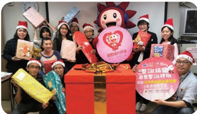
➡ 桃園遠東百貨與罕見疾病基金會共同推出「聖誕捐愛 募集聖誕禮物」活動，讓罕病孩童度過難忘、美好的聖誕節。