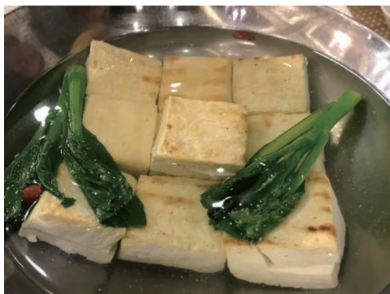
▲ 白起豆腐——高平當地人的「千年一恨」。

致趙國 40 萬部隊被俘，並且被坑殺，由於殺戮極慘，當地人恨透了白起，因此高平（即戰國時代的長平）的人民把豆腐比作「白起肉」，以火燒水煮而食之，發洩心中之憤，是為傳統美食「白起豆腐」的由來。