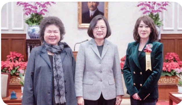
遠東 SOGO 贏得「國家品牌玉山獎——最佳人氣品牌類」首獎，黃晴雯董事長（右）獲總統蔡英文（中）接見表揚。