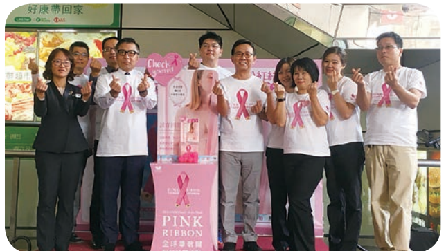
➡ 遠東 SOGO 中壢店與品牌內衣共同舉行乳癌防治活動，希望散播健康觀念給顧客與社區居民。