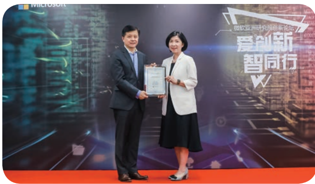
⬆ 遠傳電信井琪總經理(右)受邀出席「亞洲研究院創新論壇」，與「創新匯」成員共同探討AI最新趨勢與挑戰。