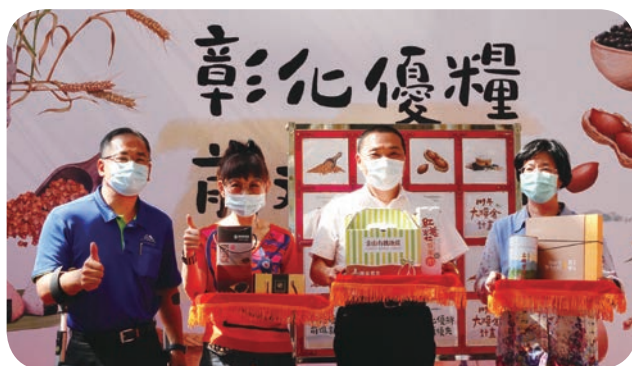
➤ 遠百板橋大遠百「彰化優糧 前進新北」熱烈開展，並邀請（左起）喜樂小兒麻痺關懷協會陳忠盛理事長、遠東百貨徐雪芳總經理、新北市侯友宜市長、彰化縣長王惠美共同站臺宣傳。