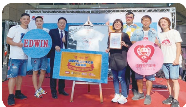
⬆ 遠百桃園店舉行「EDWIN 公益贊助暨大改樂團 LIVE BAND 演出」，幫助桃園市私立少年之家的少年們與社會接軌。