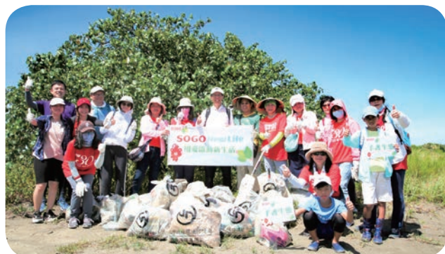
⬆ 遠東 SOGO 百貨志工社前往新北市八里區北堤沙灘淨灘，守護濕地生態。