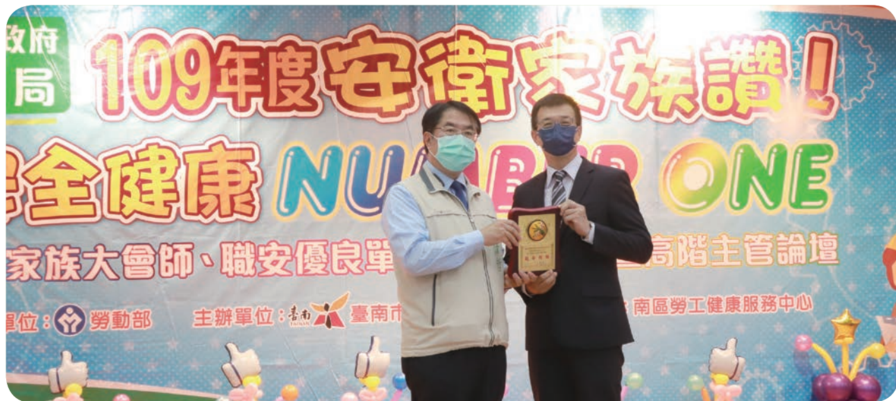
⬆ 臺南大遠百榮獲臺南市 109 年職業安全衛生優良單位獎，由黃偉哲市長親自頒獎，許俊明店長代表領獎。