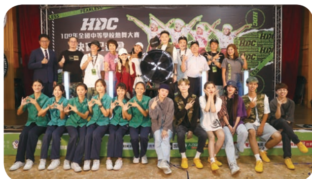
⬆ 遠東百貨長期贊助全國中等學校熱舞大賽，鼓勵學子跳出青春樂章。