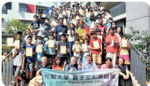
⬆ 元智大學為桃園在地國中舉辦「寰宇文化英語營」，帶領學員體驗異國文化風情。