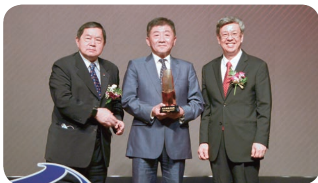
➤（左起）徐旭東董事長與本屆「有庠科技獎—有庠科技貢獻獎」得獎人衛福部陳時中部長，以及頒獎人陳建仁前副總統合影留念。