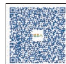
掃描QR Code閱讀 更詳細文章內容

因應各商圈的不同客群，建議品牌與店家善用商圈自身的集客優勢，創造差異化特色。以下針對各商圈提供經營建議：