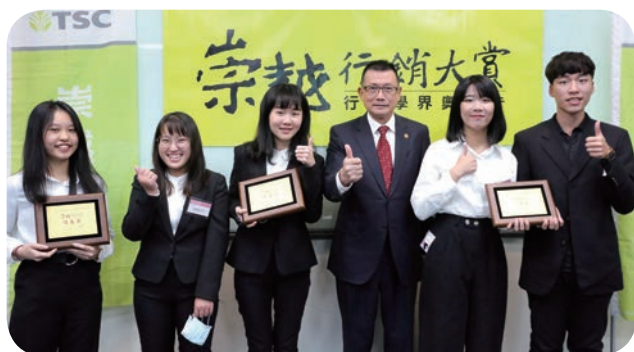
➡ 元智大學資訊學院資訊管理系師生以「安心、永無止境」的提案，參加「2021 第六屆 TSC 宗越行銷大賞」，榮獲行銷企劃優良獎殊榮。