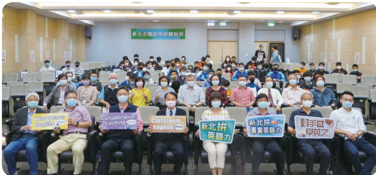
➡ 亞東技術學院 4 月 28 日辦理「新北市 109 學年度職場英語體驗營」，共計 6 所高中職校、58 位學生參與，獲得滿堂彩。