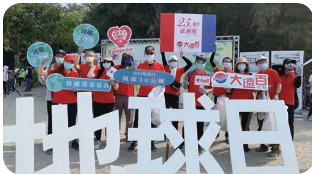
➡ 臺南大遠百參加臺南市環保局舉辦之「漁光島春季淨灘」活動，呼籲民眾正視海洋廢棄物議題。