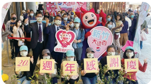
➡ 新竹大遠百與林務局竹林區管理處合作舉辦「捐發票做愛心 -- 公益贈苗」活動，提倡以實際行動減碳、減塑，共同愛護地球環境。