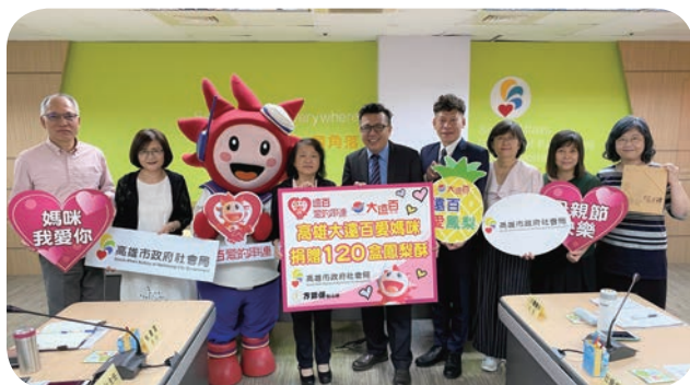
➡ 高雄大遠百推出「愛鳳梨嘉年華」愛媽咪公益活動，共捐贈 120 盒鳳梨酥禮盒予社會局轉贈單親家庭，讓單親家庭的媽媽們也能感受到社會的溫暖。