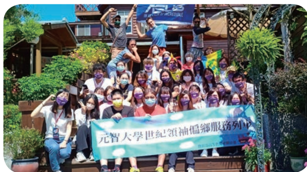
➡ 元智大學學務處課外活動組帶領新世紀領袖、機器人研究社等社團，以及來自哥倫比亞、聖文森、泰國及越南等外籍生，組成 20 人偏鄉服務列車，利用雙十連假進入偏鄉部落推廣 AI 資訊教育及國際教育。