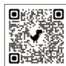
歡迎諮詢亞東醫院 家庭醫學科

雖然成年人的抵抗力好，但仍需思及同住家人的安危，孕婦更應考量胎兒的健康，藉由施打疫苗，提升自己與家人的保護力。亞東醫院家庭醫學科設有國際旅遊門診，建議大家依據個人疾病史、疫苗史及危險因素，先檢視可能需要的疫苗選項，請醫師做全面性的疫苗接種評估，補施打所需疫苗。