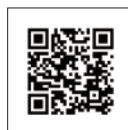
數據之鑰系列分享 YouTube 連結

10 多年前或許你從沒想過，房子和車子可以與別人共享，或許在不久的將來，品牌自有數據的分享及共享也將成為新常態，透過品牌數據融合，打一場共創、共贏的團隊戰。