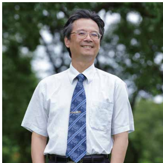
元智大學／吳志揚校長

除了陸生招生之外，元智未來還將布局「三東」。所謂的「三東」，即東歐、東南亞，以及中東。這些地區不論科技或教育，我們都可以提供協助，且相較於其他先進國家，臺灣的學費低廉，這些區域的人民較負擔得起，相對更有意願來臺灣留學。對於東南亞國家（如菲律賓、馬來西亞、印尼）的學生而言，元智大學以雙語大學著稱，至少三分之一專業課程採英語教學，語言上應不是問題。況且除了管理學院原有的英語專班之外，元智正著手規劃各學院的英語專班，以吸引更多外籍生及僑生的就讀；中東地區因為全世界反恐因素，人潮也開始往亞洲跑，歐洲則因為難民潮，迫使東歐積極與亞洲接觸，或許現階段仍無法大幅提升「三東」學生的比例，卻是未來可以努力的方向，值得把握。此外，元智的教學方式可引導學生多方思考，東西方文化的兼容並蓄，跨學院以及跨領域的學習學程、大三以上的海內外專業實習……等，都是我們得以對外開疆闢土，尋求新的契機與發展的良好條件，加上臺灣的生活環境良好，科技水準優良，對外籍生來說，相信具有一定的吸引力。