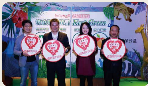
臺中大遠百以「叢林風、綠色購物」為主題，舉辦綠色市集，並將所得捐贈臺中慢飛天使立達啟能訓練中心，實現愛的串聯。