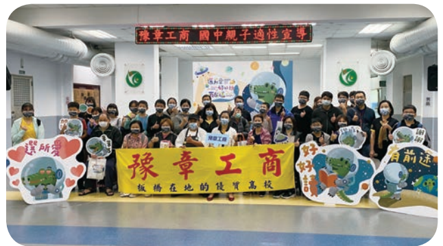
豫章工商 3 月 19 日辦理「技職教育發展趨勢」講座，並透過各科實作體驗活動，增進學生對於技職教育的了解。