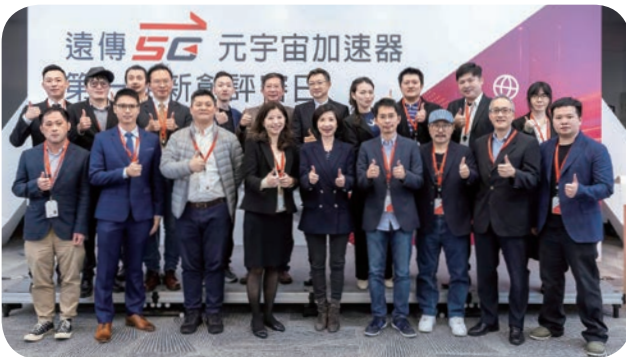
井琪總經理（前排右五）與20家入選「遠傳5G 元宇宙加速器」的新創隊伍合影，未來遠傳將提供技術、行銷、業務與財務團隊，加速開發元宇宙的應用場景。