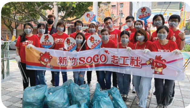
遠東 SOGO 百貨新竹店志工社於 3 月 17 日號召同仁，協助清掃隆恩圳步道周遭環境，以實際行動展現 CSR 精神。