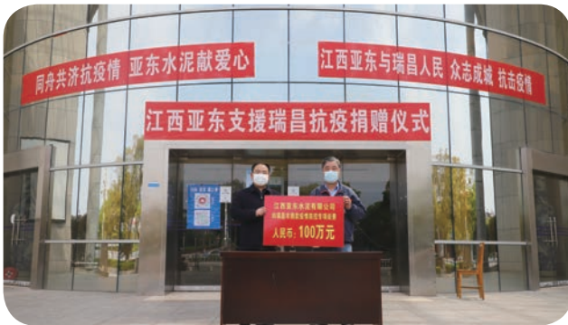
為支持瑞昌市政府抗疫工作，江西亞東水泥調派人員、車輛與物資，俞劍屏總經理（右）更代表公司捐贈 CNY100 萬，獲得當地政府及社會各界高度評價。