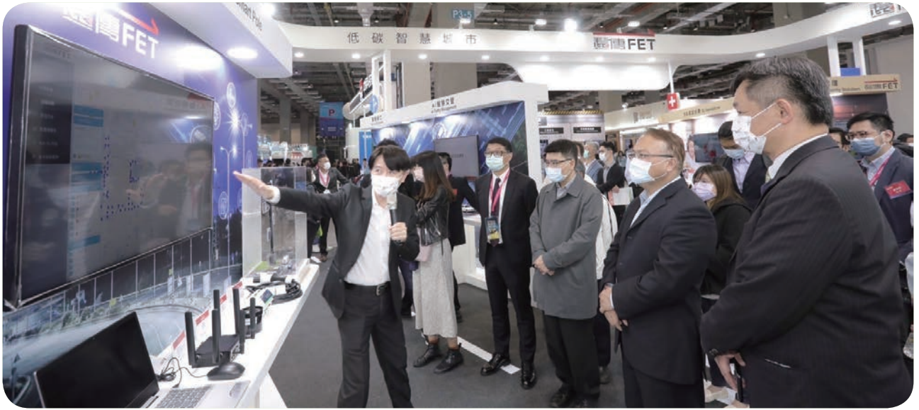
遠傳於「2022 智慧城市展」中，展出 5G 智慧工廠、5G 遠距診療服務、智慧建築、智慧零售 OMO，以及智慧交通…等多項解決方案，受到高度關注。