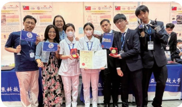
➡ 亞東科技大學團隊創作的「具動態回饋型的仿真人指導復健系統」，榮獲「第 34 屆馬來西亞國際發明展」泰國特別獎與金牌獎，師生開心合影留念。