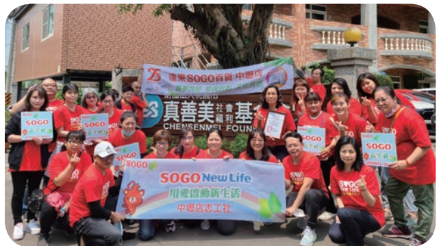
➡ 中壢店志工社前往真善美社福基金會，協助憨兒們包裝禮品，散播關懷種子。