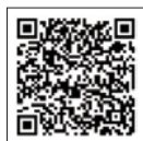
醫療分級機構 查詢