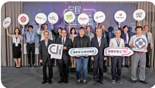
➡ 遠傳、遠傳 friDay 購物派員出席「全民反詐，電商一齊」記者會，宣示防犯詐騙的決心。