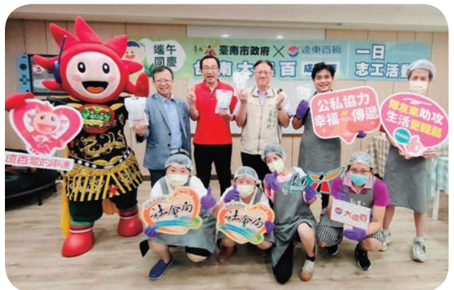
➡ 臺南大遠百同仁於朝興基金會附設啟能中心擔任一日志工，陪伴憨兒製作芝心捲，溫馨過端午。