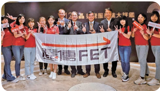
➡ 2023「臺灣服務業大評鑑」成績揭曉，遠傳電信蟬聯電信通路服務金牌獎，達成全臺唯一的12連霸佳績，團隊開心合影留念。