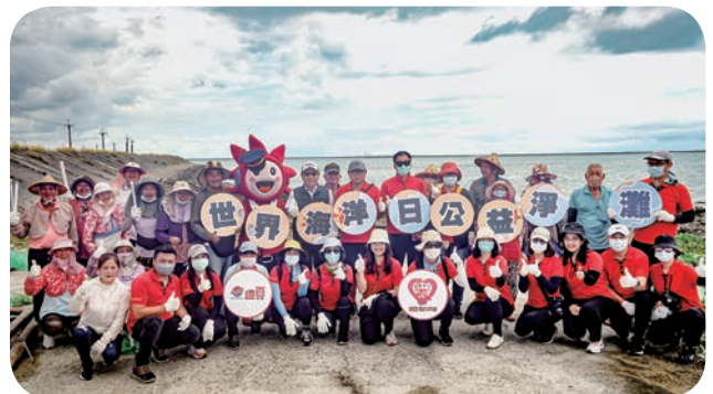
➡ 遠東百貨嘉義店攜手東石鄉居民，前往認養的東石鄉網寮漁港海岸線淨灘，以行動守護大自然。